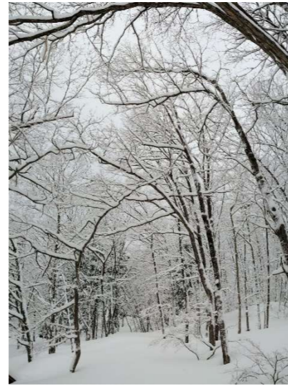
03 管理用道路 コナラ樹