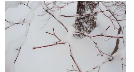
05 上 ヤマモジ 下 冬芽