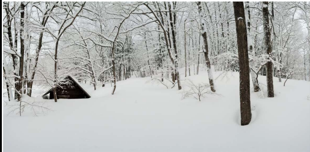
01 森林公園入口からコナラ林を見る panorama編集