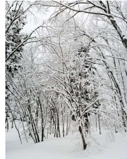
04 コハウチワカエデ冬姿