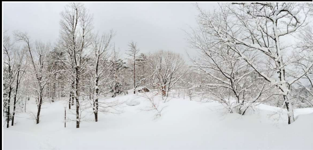
06 大曲の樹木 コナラ アカマツ ミズナラ ネム クヌギ オオヤマザクラ コナラ