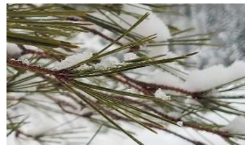
02 アカマツの葉(2葉) 森の緑は針葉樹だけ