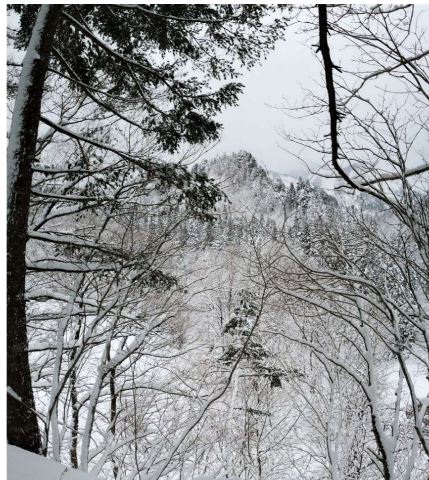
11 細尾根の林間から 中央の岩村展望台(流紋岩溶岩の突起)を見る