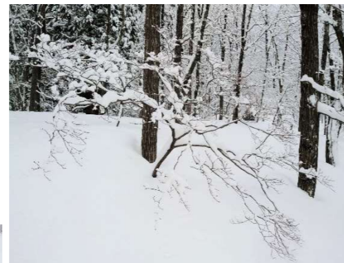
09 ハウチワカエデ樹形