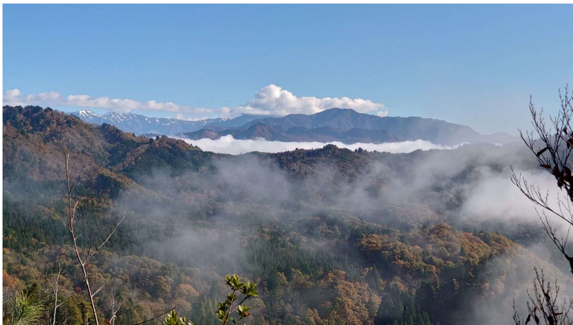
m DSC_7397 遙か遠く飯豊を望む 手前真中に馬の髪山、右大きく西大日 R03.11.06AM0937.jpg

裏五頭岩村展望台からの眺望全体図にお示ししました地図を比較するとその拡がりの大きさとこれもまた「美しい」と感動します。