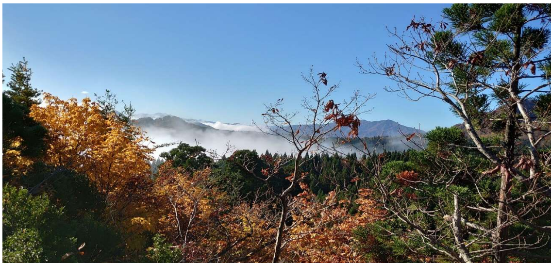
m DSC_7376 西に遠く屋敷岳背後の白山&菅名山塊 R03.11.06AM0931.jpg