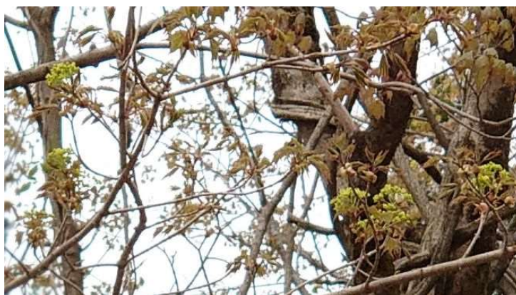
R03.04.25 イタヤカエデ開花

撮影したものを比較表にあらわしました、これから写真の撮り方をもっと工夫していきたいと思います。