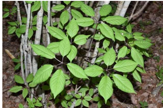
DSC_6563 コシアブラ美 2019年05月12日 AM0536.JPG