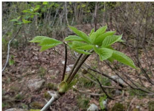
DSC01652 コシアブラ展葉 2020年05月01日 AM0636.JPG