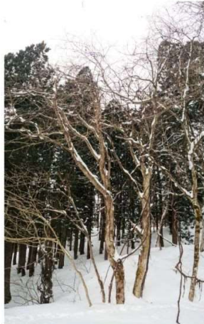
DSC_2061 3の1 三階滝沢右岸のトチノキを捜して R05.02.23AM0821 S.JPG