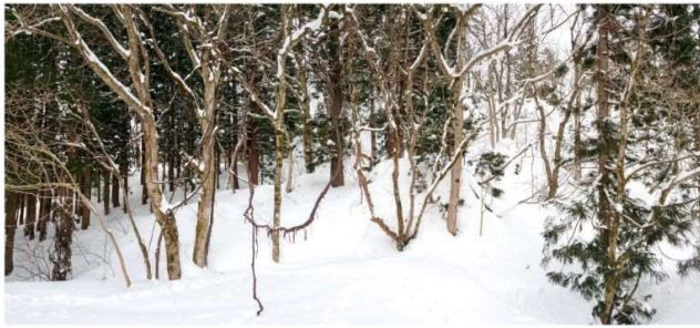
DSC_2060 三階滝沢右岸のトチノキを捜して R05.02.23AM0821 S.JPG