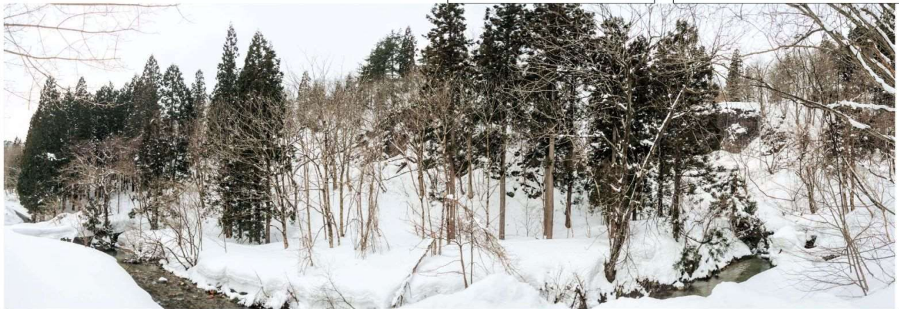
DSC_2104 © 三階滝沢左岸側から見る 杉大木の中にトチノキの森 R05.02.23PM1201 S.JPG

※ 前回 HP 示では、ここに動画を貼っていました。 文書のみ履歴を残します 「上の写真で説明した、 岩穴からの動画をご覧ください。」 と up していました。