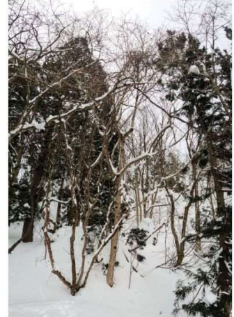
DSC_2063 3の3 三階滝沢右岸のトチノキを捜して R05.02.23AM0821 S.JPG