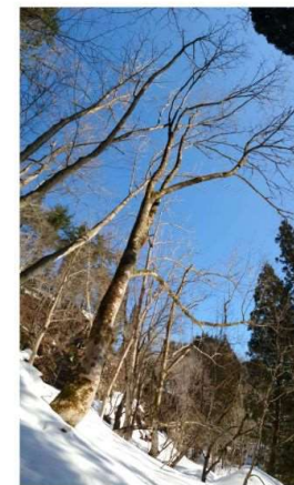
m DSC_2169 トチノキの冬 R05.03.05AM0815 S.JPG

樹間越しに見る裏五頭景観 & 岩穴前面トチノキ・ホオノキ R05.03.05 撮影