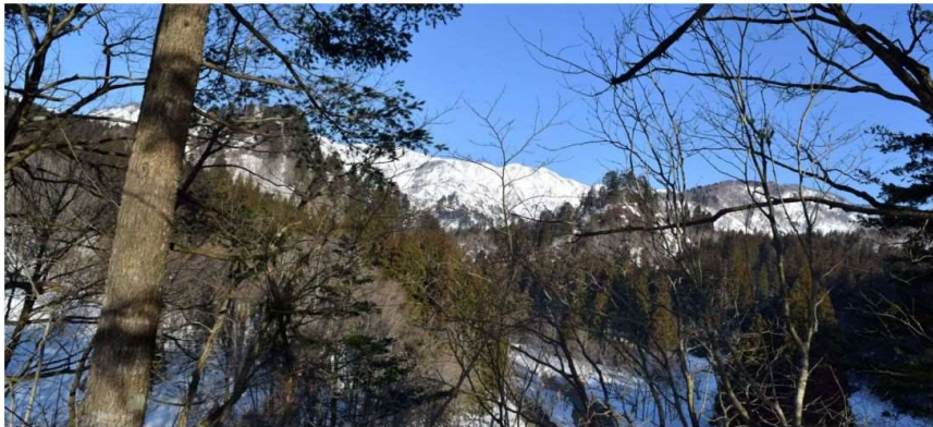
m DSC_2272 流紋岩山塊の頂点から裏五頭望む panorama R05.03.05AM0735 N.JPG