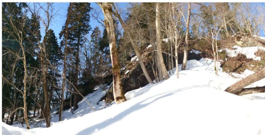
m DSC_2178 岩穴前面 トチノキ&ホオノキ R05.03.05AM0823 S.JPG