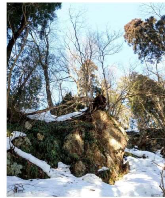
m DSC_2144 流紋岩山塊南急崖斜面 R05.03.05AM0751 S.JPG