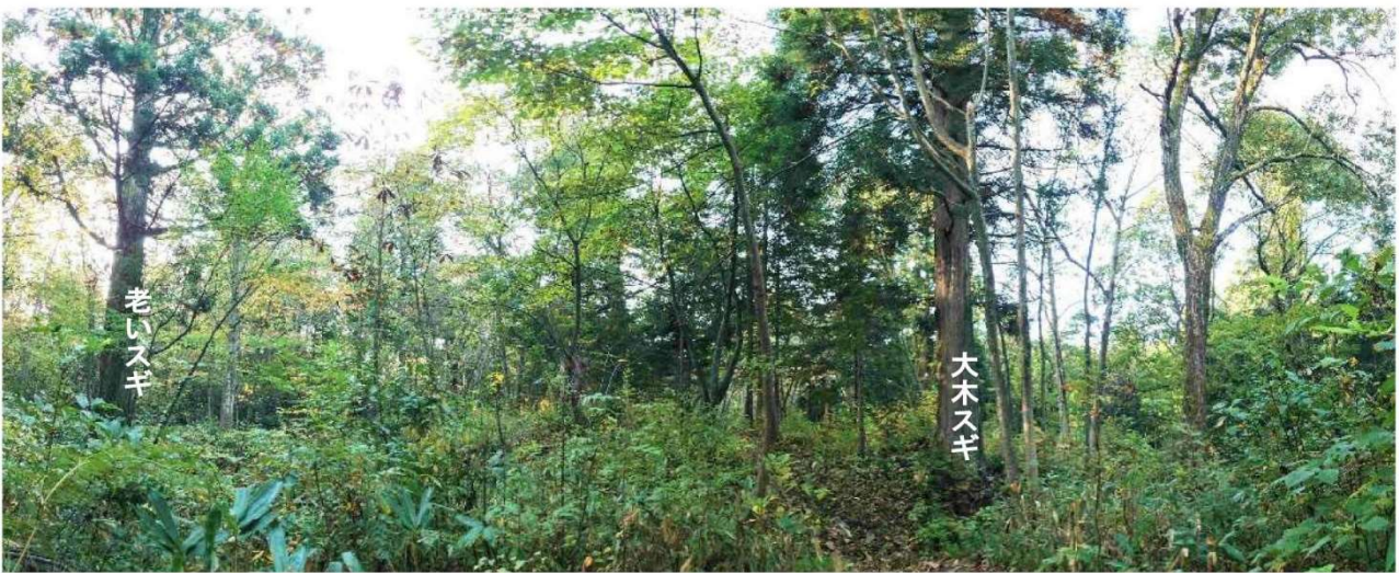
m DSC_3854 老いスギ エゴノキ サクラ 細ウワミズザクラ ハクウンボク 大スギ コナラ大 R05.10.19AM0729 S.jpg