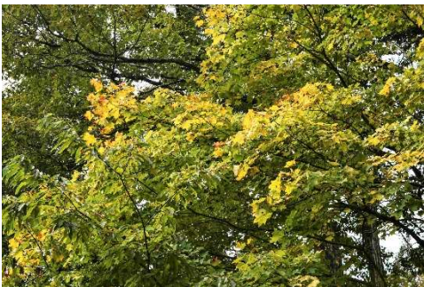
m DSC_4608 イタヤカエデ黄葉 R05.10.27AM1125 N.jpg