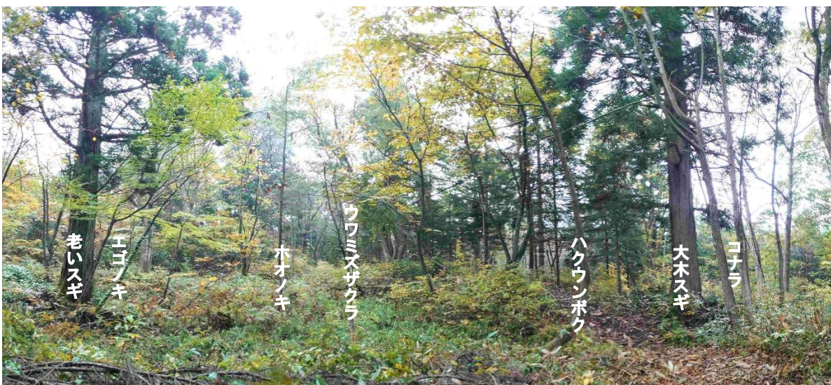
m DSC_3869 老いスギ 右根元細エゴノキ 細ホオノキ 細ウワミズザクラ ハクウンボク 大木スギ コナ ラ2本 R05.10.27AM0747 S.jpg