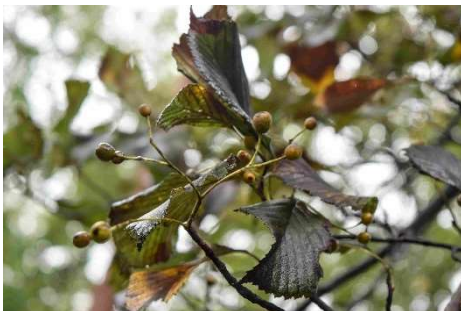
m DSC_8313 アズキナシの実 炭病にかかって R06.10.05AM0932 D5300.jpg