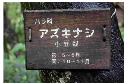
m DSC_8317 アズキナシ樹名板 R06.10.05AM0933 D5300.jpg