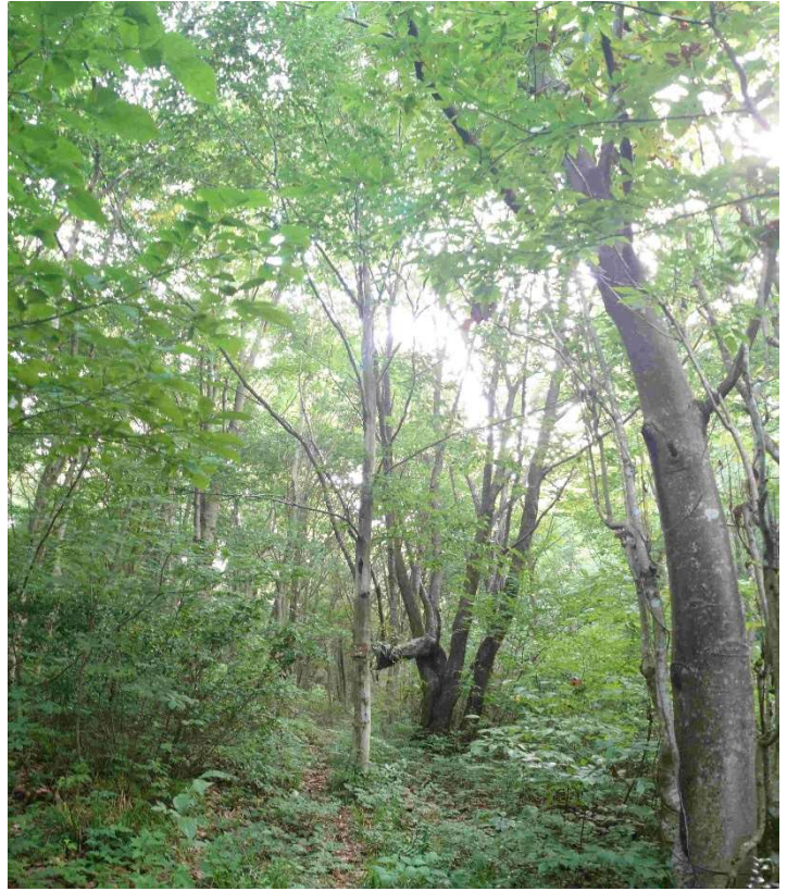
m DSC_5213 ブナ&ヘシオレザクラ R06.08.04AM0704 S.jpg