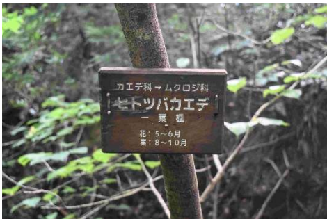
m DSC_8021 ヒトツバカエデ 樹名板 R06.08.04AM0709 D5300.jpg