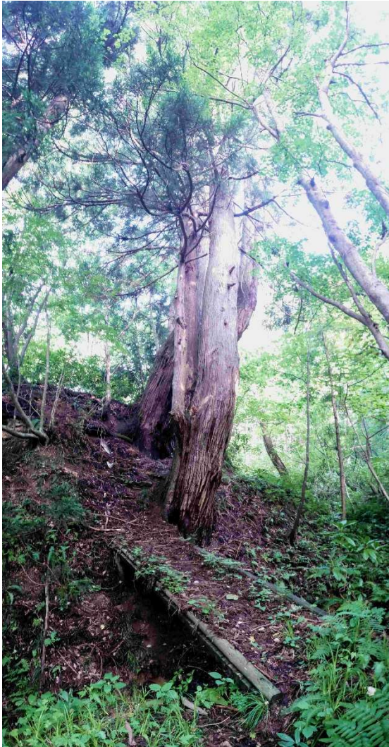
m DSC_5214 大杉橋 R06.08.04AM0706 S.jpg