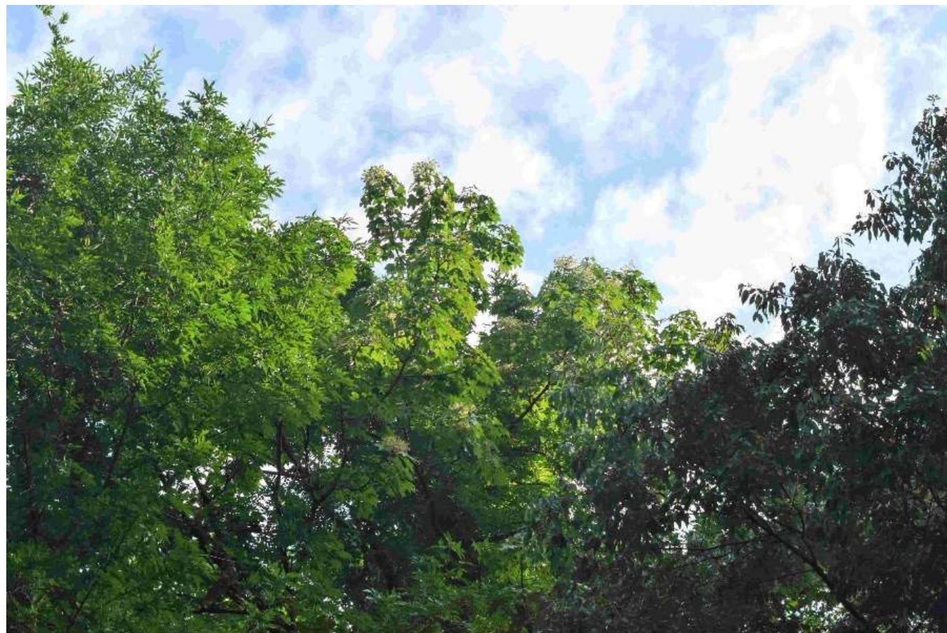
m DSC_8035 ハリギリ 開花 R06.08.04AM0734 D5300.jpg

今回はヒトツバカエデの翼果を真近に観察できました、そしてハリギリ満開の美を堪能することができました。