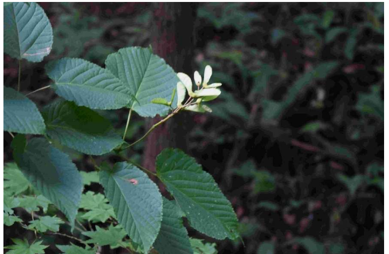
m DSC_8031 ヒトツバカエデ 翼果 R06.08.04AM0718 D5300.jpg