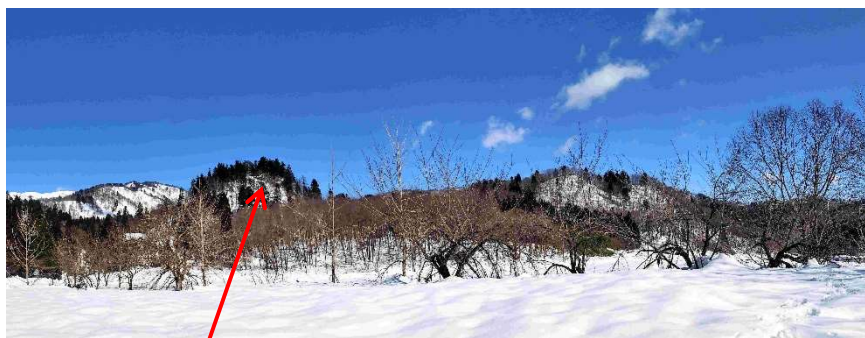
ヤエザクラ 遠景 ※ どの樹がどの樹なのか？