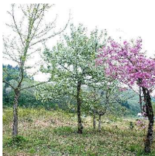
ナシ 真中 左イチヨウ 右ヤエザクラ