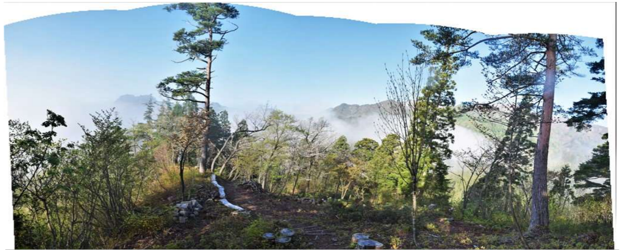
屋敷岳から中ノ岳五頭山panorama ヒメコマツ・タカノツメ・ヒメコマツ 2019年05月04日